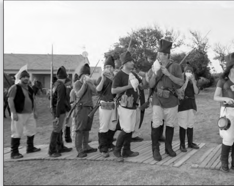
I Naziunali ont fait leur défilé au son du « cor »

Celui-ci est couronné lors de la consulte du couvent d'Alésani le 15 avril 1736; son règne sera éphémère. Le 10 novembre, il quitte la Corse pour aller chercher des aides. Au mois de février 1737,