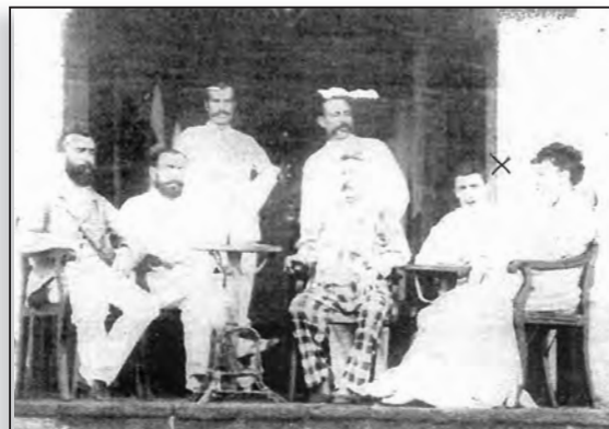
Arthur RIMBAUD, Correspondance 1888-1891, L'Imaginaire, GALLIMARD, 1995.

« L'art est une sottise », selon lui. Oui, pour quelqu'un qui l'a dépassé, qui a exprimé «l'inexprimable». La « Correspondance » est précédée d'abondantes indications biographiques. Rimbaud , un aventurier ? Pas seulement. Un fou ? Oui et non, si l'on sait qu'il doit bien exister autre chose encore que l'inexprimable. La réponse est dans ses lettres de pure poésie, et plus que lire, il faut écouter cette voix qui n'aura pas tout dit.