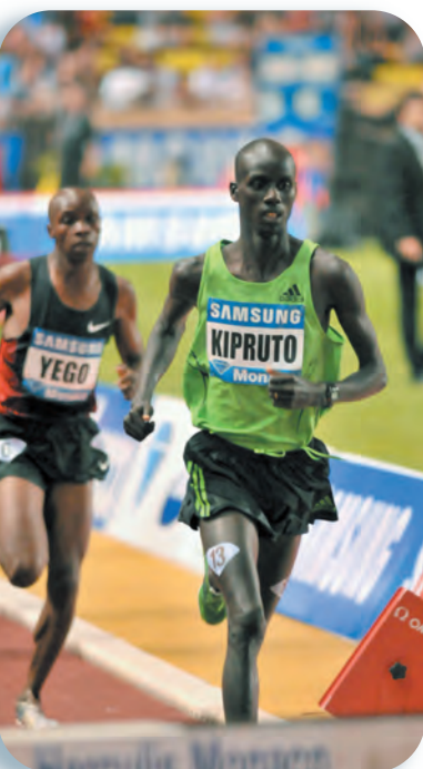
Kipruto vainqueur du 3000 steeple