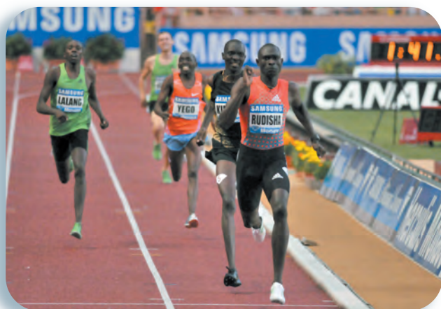
David Rudisha vainqueur du 800