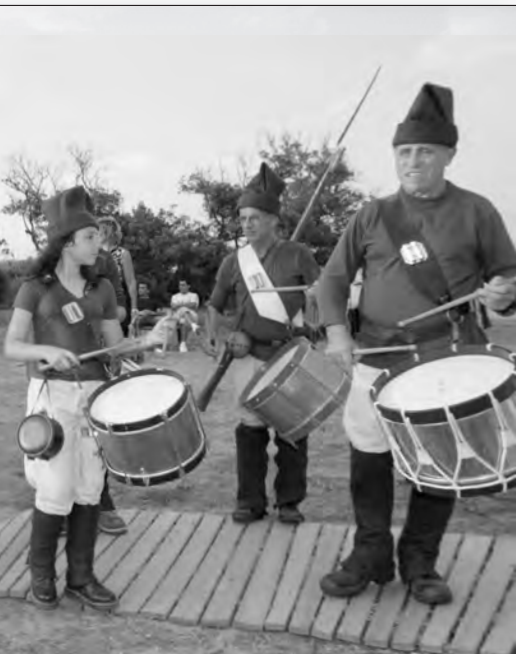
du « cornu »