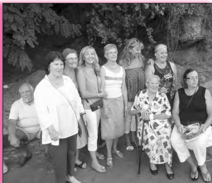
Une partie des adeptes de Ficaghjola, en image