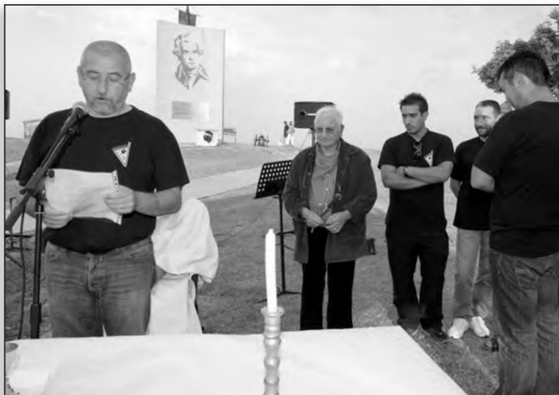
Le groupe Madricale a chanté le Diu vi salvi Regina au pied de la stèle

A Padulella a fait sa fresque historique et marqué une fois encore ce jour mémorable d'une de ces manifestations de qualité, comme se plaisent à les vivre les héritiers paolistes.