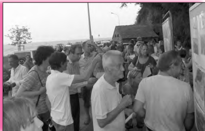
Les fidèles baigneurs de Ficaghjola se sont réunis en collectif et ont récemment organisé une exposition de photographies souvenirs, mettant à l'honneur leur plage de prédilection. L'occasion également de partager un bel apéritif musical avec de nombreux Bastiais

Ficaghjola, chaque 1er janvier. "C'est devenu un moment incontournable. Qu'il pleuve, qu'il vente ou qu'il neige, nous sommes, en moyenne, une vingtaine de baigneurs fidèles à terminer le réveillon du 31 sur la plage, en savourant des biscuits, du chocolat et du champagne. Histoire de donner une note conviviale à l'actualité qui est souvent marquée par de tristes drames et faits divers".