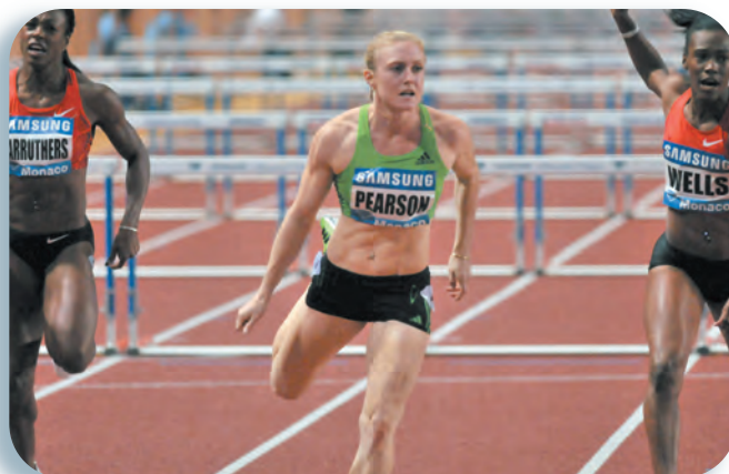
Sally Pearson number 1 sur le 100 haies