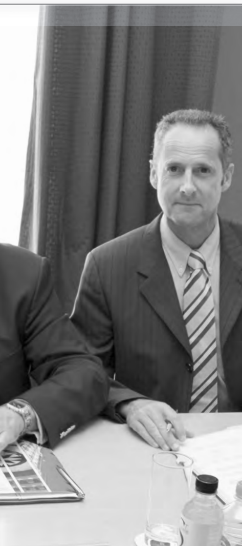
ôtel de Région

Corse sont les produits PLUS (prêt locatif à usage social) et PLAI (prêt locatif aidé d'intégration), ayant pour objet la partie travaux des opérations éligibles au dispositif. Les prêts fonciers sont donc exclus. Précisant que chaque dossier de financement devra faire l'objet d'une demande écrite adressée par l'opérateur à la CTC et à la Caisse des dépôts, la convention rappelle également qu'aucun contrat de prêt ne pourra être programmé au-delà du 31 décembre 2011 et que la date limite d'engagement des contrats est fixée au 30 juin 2012 avec une date de signature au plus tard le 31 décembre 2012.