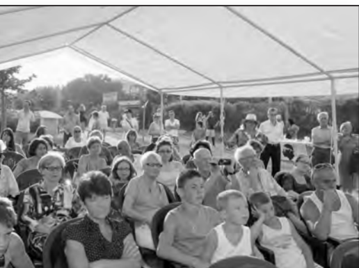
La messe a été suivie par un public recueilli