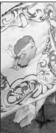
La messe a été célébrée et c...