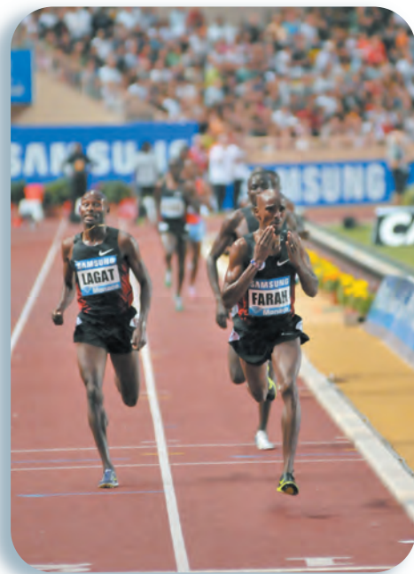
Mo Farah devance Bernard Lagat sur le 5000